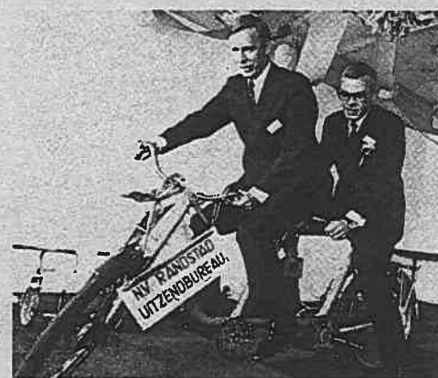
Randstad-oprichter Goldschmeding bracht zijn eerste flexwerker achterop de fiets naar de klant.

Uitzendwerk kreeg in Nederland voet aan de grond toen Frits Goldschmeding en Ger Daleboudt in 1960 Uitzendbureau Amstelveen oprichtten. Goldschmeding signaleerde in zijn afstudeerscriptie een groeiende behoefte bij werkgevers aan